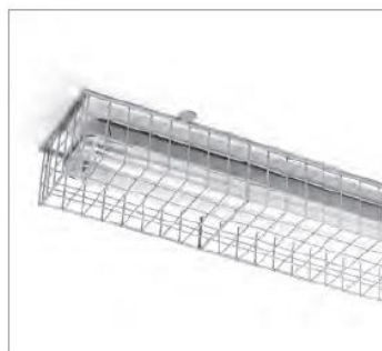
36W - 341946