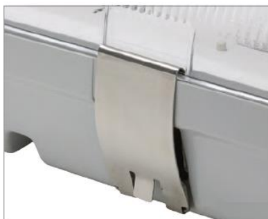
Opcja / Option