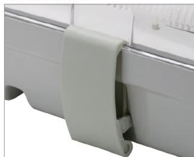
Standard / Norme